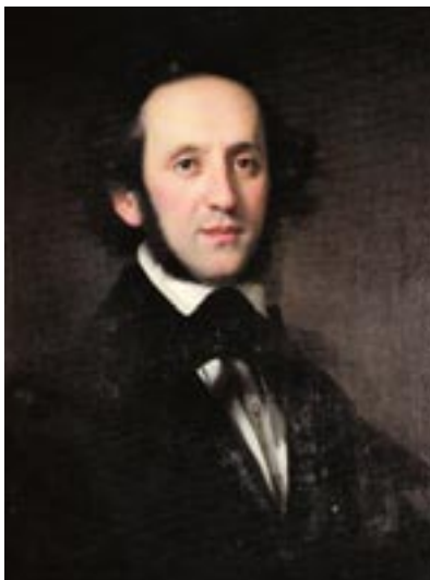
Felix Mendelssohn Bartholdy von Eduard Magnus, Öl auf Leinwand, um 1833.

Als er sieben Jahre alt war, im Jahr 1816, hatten die Eltern ihn und seine Schwester Fanny protestantisch taufen lassen. Die Geschwister erhielten nun zusätzlich den „christlichen“ Nachnamen Bartholdy. Der Aufforderung des Vaters, sich fortan nur noch Bartholdy zu nennen, kam Felix nicht nach. Selbstbewusst hielt er auch an seinem ursprünglichen Familiennamen Mendelssohn fest. Antisemitische Diskriminierung begleitete ihn sein Leben lang. „ Er ist zwar ein Judensohn, aber kein Jude “, schrieb beispielsweise Carl Friedrich Zelter, Leiter der Berliner Singakademie und Mendelssohns Musiklehrer, im Oktober 1821 an seinen Freund Johann Wolfgang von Goethe, „ es wäre wirklich einmal eppes Rohres wenn aus einem Judensohne ein Künstler würde. “ Als Mendelssohn diese Bemerkung später im veröffentlichten Briefwechsel entdeckte, war er tief verletzt.