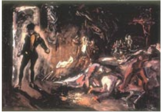
Don Juans Begegnung mit dem steinernen Gast von Max Slevogt, Öl auf Leinwand, 1906.

Für farbenreiche Dramatik sorgt ein großes und breit gefächertes Instrumentarium. Der Bläserersatz erfordert neben der Flöte, den Fagotten, Oboen und Hörnern auch Klarinetten und Trompeten. Die Pauken verleihen dem Geschehen seinen schlagenden Puls. Die sinfonische Einleitung des ersten Satzes Allegro steigt erst aus fahler Finsternis herauf und entlädt sich in einem erschreckenden, dämonischen Ausbruch. Chromatisch durchschreitet Mozart den Schmerz. Das Klavier setzt mit einem eigenen Thema ein, vorsichtig nachfragend. Tutti und Solo prallen aufeinander, gehen aber auch gemeinsame Wege, finden in mild ausgeglichenen Dur-Regionen zusammen und spinnen ihr Mit- und Gegeneinander bis ins unheimliche Verklingen fort. Pauken und Trompeten schweigen im singenden, weit ausschwingenden zweiten Satz Larghetto , auf dessen lichte Idylle mitunter der Schatten der Wehmut fällt. In diesem Changieren lässt das kammermusikalische Zusammenspiel der Holzbläser eine heitere serenadenhafte Stimmung entstehen. Drohendes Potenzial eignet dem als Variationssatz angelegten Finale Allegretto , welches sich aus einem schwungvoll-sinistren Marsch entwickelt. Es kennt angriffiges Aufbäumen in Moll ebenso wie vergnügtes Tänzeln in Dur, bekräftigt am Ende aber nachdrücklich die finstere Grundtonart. Wer die Satztitle Larghetto und Allegretto nachträglich hinzugefügt hat, ist bis heute nicht bekannt.