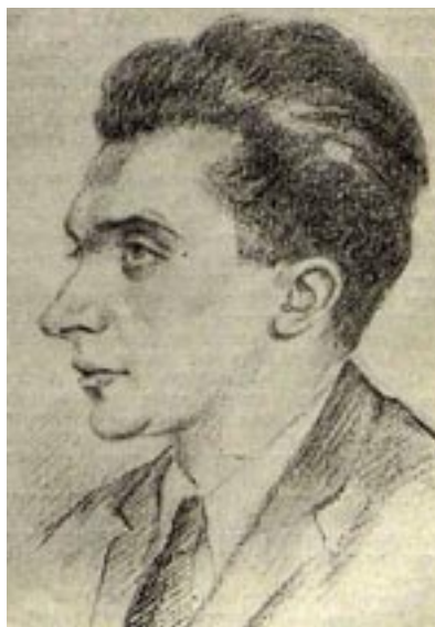
Mieczysław Weinberg von unbekannt, Skizze, 1949.

Felix Mendelssohn Bartholdys Großvater war der große Philosoph Moses Mendelssohn gewesen, welcher als Erster die jüdische Lehre mit dem Gedankengut der Aufklärung verknüpft hatte. Der Enkel hatte die Errungenschaften der Aufklärung dann zumindest ansatzweise erleben dürfen. Ein freigeistigeres Klima ließ ihn und sein Werk vorübergehend Ungezwungenheit und Versöhnlichkeit atmen. Und doch blieb er als getaufter deutscher Jude nicht unberührt von den antisemitischen Ressentiments der Zeitgenoss*innen. Ein