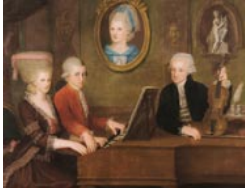
Familie Mozart von Johann Nepomuk della Croce, Öl auf Leinwand, um 1780.

Der erste Satz Molto Presto spinnt seine Themen nicht variierend weiter, sondern spielt sie als fixe Zustände in verschiedenen Tonarten durch. Das fanfarenhafte Anfangsmotiv leitet dramatische Läufe ein und wechselt mit ihnen schroff die Harmonien. Als Gegenpol tritt eine leichtfüßig tänzelnde Passage in Erscheinung. Das im Kern hitzige Geschehen mündet in beinahe resignative Erschöpfung. Von dort aus führt der zweite Satz Andante in die finsternen Regionen von c-Moll, setzt dabei den Schmerz dissonanter Reibungen frei, verleiht Seufzern Gewicht, kennt gelegentlich aber auch Trost. Eine kurze Steigerung am Ende leitet nahtlos über in den im Wesentlichen gut gelaunten dritten Satz Allegro , worin jagdhornhafte Dramatik und tänzerischer Schwung miteinander wetteifern. Mollgetrübte Blitze durchzucken seine Heiterkeit, die am Ende den Sieg davonträgt.