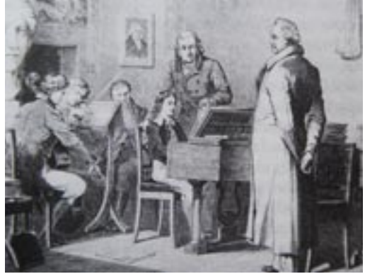
Mendelssohn bei Goethe im Junozimmer von unbekannt, Radierung, 19. Jahrhundert.