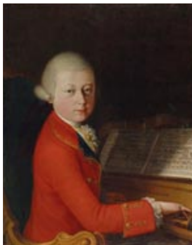
Mozart mit 13 Jahren von unbekannt, Öl auf Leinwand, um 1770.

Besetzung: 2 Flöten, 2 Oboen, 2 Fagotte, 2 Hörner, 2 Trompeten, Streicher