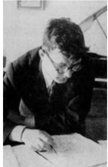
Dmitri Schostakowitsch von unbekannt, erschienen im Juli 1942 im Knoxville News Sentinel.

Zur selben Zeit entstand ebenfalls in Taschkent Weinbergs erste Sinfonie, welche die Aufmerksamkeit von Dmitri Schostakowitsch erregte. Dieser sorgte dafür, dass Weinberg im Jahr 1943 seinen Wohnsitz in Moskau nehmen konnte. Beide blieben einander zeitlebens künstlerisch und freundschaftlich eng verbunden. Nach dem Zweiten Weltkrieg schlug auch in der Sowjetunion der Antisemitismus in staatliche Säuberungsaktionen um. Weinbergs Schwiegervater, der auch im Westen gefeierte jüdische Schauspieler und Theaterleiter Solomon Michoëls, wurde auf Geheiß Stalins 1948 ermordet. Weinberg selbst wurde 1953 wegen „jüdischen Nationalismus“ inhaftiert. Er verbrachte fast drei Monate in Gefangenschaft, deren Ende er wohl vor allem Stalins Tod am 5. März 1953 verdankte. Auch danach wurden Komponist*innen immer wieder eingeschüchtert, wenn ihre Musik nicht einem volksnahen „sozialistischen Realismus“ entsprach. Nie konnte man sicher sein, wie Gnade und Ungnade gerade verteilt wurden. Auf vielfache Weise, doch stets chiffriert und andeutend, reagierte Weinberg in seinem umfangreichen Werk auf die Erfahrungen des Totalitarismus.