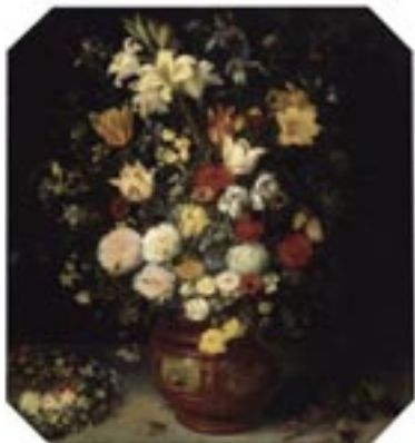
Blumenstrauß von Jan Brueghel (der Ältere), Gemälde, um 1620.

jour ( Cestrum diurnum ) gewidmet. Nach vier Takten beginnt die Oboe mit einer friedlichen Kanti-lene, gefolgt von Klarinette und Flöte. Es folgt ein bewegter Satz mit heiteren Unterhaltungen der Holzbläser für Cupidon bleu (Blaue Kugeldistel). Dem um 10 Uhr zu blühen beginnenden Cierge à grandes fleurs , Säulenkaktus, ist der weich strömende folgende Satz im 12/8-Takt gewidmet. Flotte Klänge wie aus dem Tanzsaal ertönen im Duosatz für Oboe und Klarinette an die Nyctanthe du Malabar , eine Jasminart aus dem heutigen indischen Staat Kerala. Bereits um 17 Uhr erblüht die Belle de nuit (Wunderblume) mit lang schwingen-den Kantilenen über einer durchgehenden Begleitung in der Harfe. Gar nicht traurig, sondern ziemlich munter erklingt folgende Satz für die Geranium triste (vielleicht ist jedoch Pelargonium triste gemeint, eine duftende, nachtblühende Sorte) mit einem äußerst spritzigen Ensemble der Holzblä-ser. Der letzte Satz beendet die Suite mit fröhlich hüpfenden Rhythmen und lustigen Eruptionen wie ein Karnevals-marsch und ist der Silène nocti-flore (Acker-Lichtnelke) gewidmet.