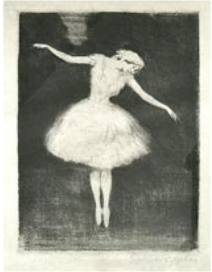
Anna Pavlova als sterbender Schwan von Ernst Oppler, Zeichnung, um 1915.

Mozart gefeiert. An der noblen Église de la Madeleine begeisterte Saint-Saëns über zwanzig Jahre lang jeden Sonntag mit Improvisationen auf der Orgel das Pariser Publikum. Wenn befreundete Musiker*innen wie Clara Schumann, Anton Rubinstein oder Franz Liszt zu Besuch waren, verwandelte sich die Orgelempore so manches Mal in ein Kunstzimmer. Der Begriff „Genie“ lässt sich wohl zu Recht auf Saint-Saëns anwenden. Er komponierte nicht nur rund 300 Werke, darunter 12 Opern, sondern schrieb Gedichte, Komödien, Essays sowie Kritiken und betrieb astronomische, historische und philosophische Studien. Von seinen ersten Tantiemen kaufte er sich ein Teleskop. Bei seinem Tod mit 86 Jahren, als die Wellen des Impressionismus schon wieder verebbt waren, galt Saint-Saëns als musikalisch veraltet. Obwohl er durchaus nach neuen Ausdrucksmitteln strebte und teilweise die Grenzen der tonalen Tradition überschritt, konnte das 20. Jahrhundert wenig mit seinen Werken anfangen, so dass heute kaum mehr als seine einzig erfolgreiche Oper Samson et Dalila und natürlich die zoologische Fantasie Der Karneval der Tiere aufgeführt werden. Aus letzterer wurde das Cellosolo in der Darstellung von Anna Pavlova als sterbender Schwan weltberühmt.