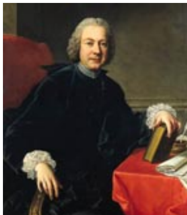
Pietro Metastasio von Pompeo Batoni, Öl auf Leinwand, um 1770.

Besetzung: 2 Oboen, 2 Fagotte, 2 Hörner, Streicher