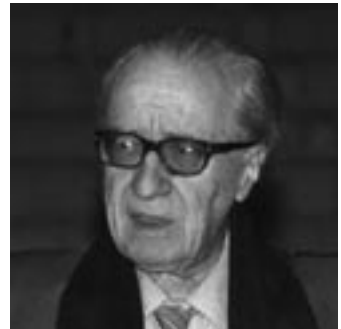
Jean Françaix

In einem Nachruf wird Jean Françaix als „Meister der fröhlichen Diversität“ bezeichnet. In der Tat ist im 20. Jahrhundert wohl kaum eine Musik komponiert worden, die mehr Heiterkeit und Anmut versprüht als die seine. Françaix, der sich gern auch als geistigen Nachfahren von Joseph Haydn sah, wollte Musik schreiben, die einfach nur Freude macht. Die scheinbare Leichtigkeit seiner Werke trug ihm so manche Kritik ein, doch Françaix kokettierte selbstironisch mit seiner angeblich mangelnden Ernsthaftigkeit und dem Verzicht auf spätromantischen Tiefsinn. Obwohl seine Lehrerin, die berühmte Nadia Boulanger, sich, nach seinen Worten, vergeblich bemühte, ihm Harmonie und Kontrapunkt beizubringen (was natürlich nicht stimmt, wie man hören kann), hielt sie ihn für einen ihrer besten Studenten. Der lustvoll verspielte Einfallsreichtum, mit dem Françaix komponierte, kommt in seinen rund 200 Werken in vielfachen Varianten zum Ausdruck. Nur selten wurde er richtig ernsthaft wie in seinem Oratorium L'Apocalypse selon St. Jean , das er selbst für sein Hauptwerk hielt.