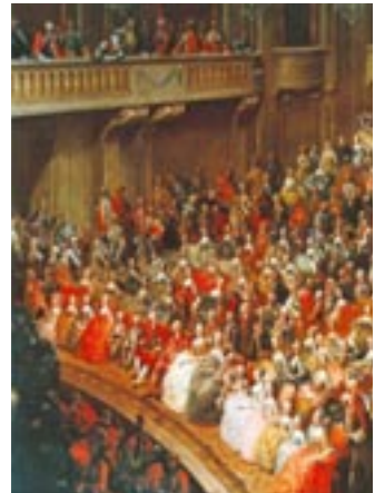
Kaiserliche Familie und Wiener Hof- gesellschaft bei der Serenade in den Redoutensälen der Hofburg von Martin van Meytens und Johann Franz Greipel, Gemälde, 1763.