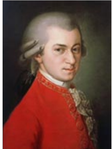
Wolfgang Amadeus Mozart von Barbara Krafft, Öl auf Leinwand, 1869.

Das Reisepensum des jungen Mozart war ebenso erstaunlich wie sein Lernpensum und die nahezu kontinuierliche Produktion von neuen Sonaten, Sinfonien, Opern, Liedern und Arien. Früheste Konzertreisen führen den Sechsjährigen mit