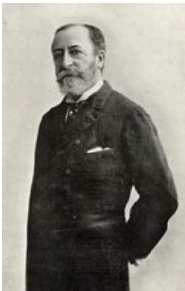
Camille Saint-Saëns von Charles Reutlinger, Fotografie, um 1880.

jour ( Cestrum diurnum ) gewidmet. Nach vier Takten beginnt die Oboe mit einer friedlichen Kanti-lene, gefolgt von Klarinette und Flöte. Es folgt ein bewegter Satz mit heiteren Unterhaltungen der Holzbläser für Cupidon bleu (Blaue Kugeldistel). Dem um 10 Uhr zu blühen beginnenden Cierge à grandes fleurs , Säulenkaktus, ist der weich strömende folgende Satz im 12/8-Takt gewidmet. Flotte Klänge wie aus dem Tanzsaal ertönen im Duosatz für Oboe und Klarinette an die Nyctanthe du Malabar , eine Jasminart aus dem heutigen indischen Staat Kerala. Bereits um 17 Uhr erblüht die Belle de nuit (Wunderblume) mit lang schwingen-den Kantilenen über einer durchgehenden Begleitung in der Harfe. Gar nicht traurig, sondern ziemlich munter erklingt folgende Satz für die Geranium triste (vielleicht ist jedoch Pelargonium triste gemeint, eine duftende, nachtblühende Sorte) mit einem äußerst spritzigen Ensemble der Holzblä-ser. Der letzte Satz beendet die Suite mit fröhlich hüpfenden Rhythmen und lustigen Eruptionen wie ein Karnevals-marsch und ist der Silène nocti-flore (Acker-Lichtnelke) gewidmet.