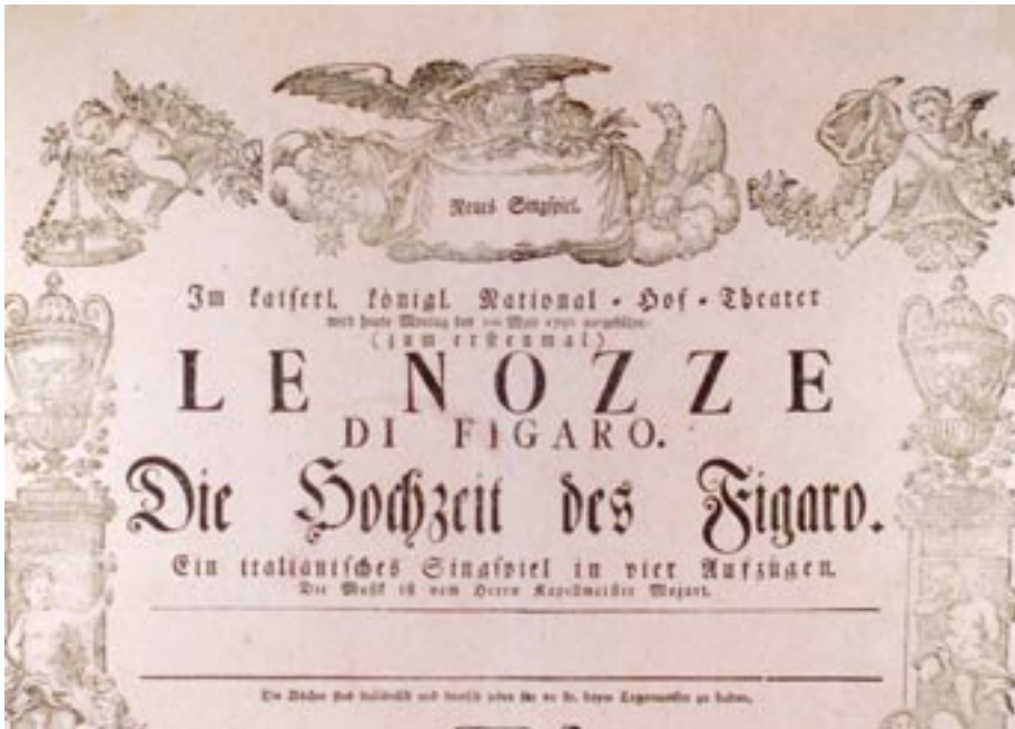
Die Hochzeit des Figaro. Plakat für die Uraufführung von unbekannt, Druck, 1786.

Sankt Petersburger Hof wirkte, Wolfgang Amadé Mozart be- traut. Unmittelbar vor der Arie „ Vado, ma dove? “ („Ich gehe, aber wohin?“) – die Mozart einfühlsam von Klarinetten und Fagotten begleiten ließ – hat Lucilla endlich erfahren, dass Giocondo wegen seines Bankrotts der Kerker droht. Verzwei- felt darüber, dass der Himmel nicht lenkend eingreift, be- schließt sie auf innige Weise, sich von ihrer Liebe leiten zu lassen, um ihrem Mann zur Seite zu stehen.