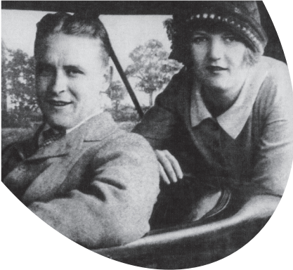
F. Scott and Zelda Fitzgerald (1920)