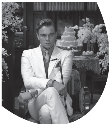
Leonardo DiCaprio in »Der große Gatsby« (2013)

Gatsby . Jay Gatsby steht Thomas («Tom») Buchanan gegenüber. Tom Buchanan pflegt ein außereheliches Verhältnis mit Myrtle Wilson, der Ehefrau eines Autohändlers und -mechanikers, George B. Wilson. Jay Gatsby ist unsterblich, idealistisch in Buchanans Ehefrau Daisy Fay verliebt. In seiner Liebe erweist er sich als entlaufener Romantiker, der sich dem Ziel seines Verlangens verschrieben hat, seitdem er Daisy zum ersten Mal erblickte. Sie mag anfangs Gatsbys Gefühle erwidert haben, doch der wird während des Ersten Weltkriegs als Major in Europa stationiert. Und alsbald lässt Daisy Fay ihn wissen, dass sie nunmehr mit Tom Buchanan verheiratet ist. Buchanans pekuniäre Möglichkeiten dürften ihn attraktiver