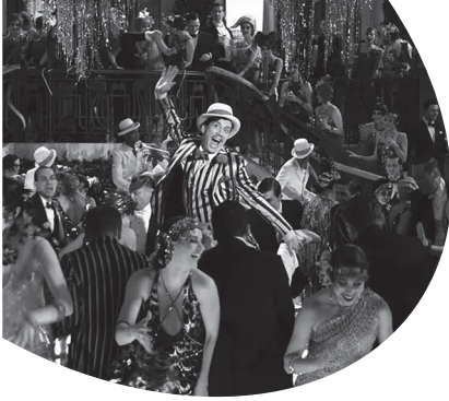
Szene aus Baz Luhrmanns »Great Gatsby«-Verfilmung von 2013

ter, auch sorgloser im Umgang mit anderen Menschen. Was der Autor letztlich allerdings in einem bitteren Kommentar zu freundschaftlichen oder für und an sich zwischenmenschlichen Verhältnissen gipfeln lässt. Nur ist Gatsby, der tatsächlich James (»Jimmy«) Gatz hieß, da längst dekonstruiert: Als kurzlebiger Neureicher, der zwar in seiner tiefempfundenen Liebe zu der einen Frau mehr als aufrichtig ist, seine Existenz jedoch auf gleich mehreren selbst erfundenen Illusionen erschuf. Damit verkörperte er einen neuen gesellschaftlichen Typus, der spätestens nach dem Ersten Weltkrieg florierte. Tom Buchanan dagegen steht für einen traditionellen Angehörigen der – freilich besseren – amerikanischen Gesellschaft. Er ist kein schillernder Charakter, der