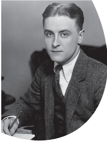
F. Scott Fitzgerald (1921)

»Once again to ZELDA« ( Einmal mehr für Zelda ), widmete F. Scott Fitzgerald seinen bekanntesten Roman. In The Great Gatsby erzählt Nick Carraway die Handlung. Er hat an der renommierten Universität Yale studiert, inzwischen handelt er mit Schuldscheinen beziehungsweise Obligationen. Während des Sommers 1922 wird ihm eine Nebenrolle in einem Drama zuteil, das sich zwischen Angehörigen der besseren Gesellschaft abspielt, vorwiegend auf Long Island, östlich von New York City. Bevor allerdings die Titelfigur ebenso unvermittelt wie selbstverständlich, für den Ich-Erzähler ebenso überraschend, im Rampenlicht erscheint, wird selbi-