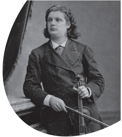
Eugène Ysaÿe (1883)

Bereits im Jahre 1893 plante Ernest Chausson, ein Solostück für den großen belgischen Geiger und Komponisten Eugène Ysaÿe zu schreiben. Der erwartete eigentlich ein »echtes« Violinkonzert. Chausson jedoch fühlte sich dem nicht gewachsen und schrieb im Juli 1893 an Ysaÿe: »Ich weiß kaum, wo ich mit einem Konzert anfangen soll, das ist ein riesiges Unterfangen, eine teuflische Aufgabe. Aber ich kann mich mit einem kürzeren Werk begnügen. Es wird eine sehr freie Form haben, mit mehreren Passagen, in denen die Violine allein spielt.« So landete die Idee vorerst in der Schublade, bevor sich Chausson im Frühjahr 1896 erneut ans Werk machte. Da Ysaÿe am kreativen Prozess teilhatte (insbesondere an der langen Kadenz zu Beginn sowie den Doppelgriffpassagen), nannte Chausson das ihm gewidmete Werk später »Mein-Dein Gedicht«. Nach der Uraufführung am 27. Dezember 1896 in den Concerts du Conservatoire in Nancy machte Ysaÿe detaillierte Änderungsvorschläge, die zwar Chaussons Zustimmung fanden, aber nicht in die 1898 in Leipzig gedruckte Orchesterpartitur aufgenommen wurden (Ysaÿes Sohn Théo veröffentlichte später posthum die überarbeitete Fassung).