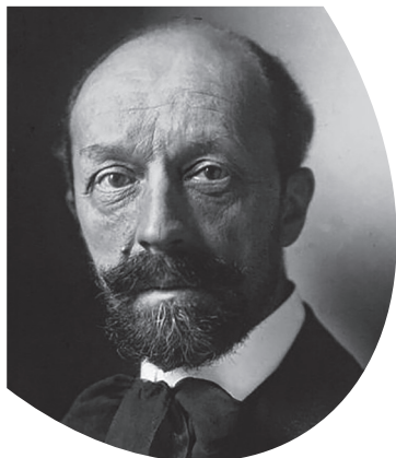
Albert Roussel (1923)

Albert Roussel wandte sich der Sinfonie, und überhaupt der Musik als Laufbahn, erst spät zu. Den ersten ernstzunehmenden Unterricht erhielt er von Eugène Gigout, der als Komponist konservativ, aber »sehr großzügig [und] frei von akademischen Vorurteilen« war, wie sich Roussel später äußerte. Wieviel Roussel tatsächlich von seinen Studien profitierte, ist unklar. Auch wenn sein Opus 1, eine Suite für Klavier mit dem Titel »Des heures passent« (1898), sich als wenig originell erweist, ließ er sich nicht entmutigen und schrieb sich 1898 in der neuen Schola Cantorum als Schüler ein; dort wurde unter der Leitung von Vincent d'Indy viel Wert auf Bach, Palestrina und andere Vertre-