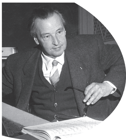
Arthur Honegger (1950)

In den 1920er Jahren arbeitete Arthur Honegger an drei kurzen Orchesterstücken, die er »Mouvements symphonique« nannte. In seiner Autobiografie Ich bin Komponist schildert er die Absicht hinter dem ersten Stück: »Um ehrlich zu sein, verfolgte ich in ›Pacific‹ ein sehr abstraktes und ziemlich ideales Konzept, indem ich den Eindruck einer mathematischen Beschleunigung des Rhythmus vermittelte, während sich der Satz selbst verlangsamte. Musikalisch habe ich einen großen figurierten Choral komponiert, der sich der Form nach an Johann Sebastian Bach anlehnt.«