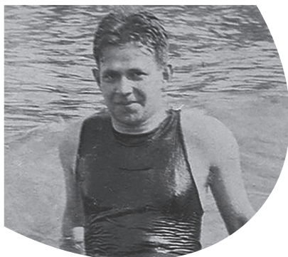
Kurt Tucholsky in Warnemünde (1912)

»Aber es ist gewiß, daß das Land in seiner jetzigen, völlig unveränderten Geistesverfassung wieder in eine Katastrophe hineintaumeln wird, genau wie im Jahre 1914: dummstolz, ahnungslos, mit flatternden Idealen und einem in den Landesfarben angestrichenen Brett vor dem Kopf.« (Kurt Tucholsky, 1924)