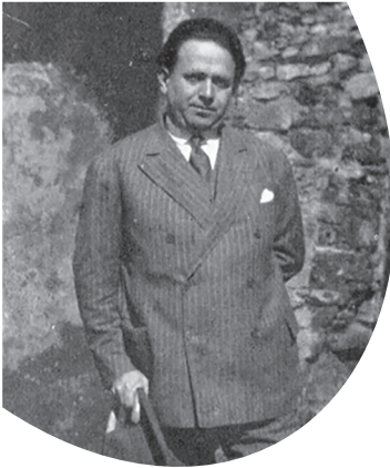
Tucholsky in Paris (1928)

Schweden. Von dort aus besuchte er Deutschland innerhalb des nächsten Jahres erneut nur, um sich kurz daselbst aufzuhalten. Im Februar 1930 bezog er die Villa Nedsjölund in Hindås bei Göteborg. Noch während desselben Jahres knüpfte er mit seiner »Sommergeschichte« Schloss Gripsholm an seinen ersten nennenswerten Erfolg Rheinsberg an. Weitere Auslandsaufenthalte in Österreich, abermals Paris, in London und Kent sowie in Kopenhagen und in der Schweiz, schließlich in Prag unterbrachen seine Zeit in Schweden und dürften widerspiegeln, wie ruhelos Tucholsky damals war. Aufgrund seiner sich verschlechternden Gesundheit und der sich ebenso entwickelnden politischen Lage zog er sich zusehends aus der Öffentlichkeit zurück, verstummte als Schriftsteller, kritischer Beiträger und Redner. Während Adolf Hitler als Reichskanzler die Macht