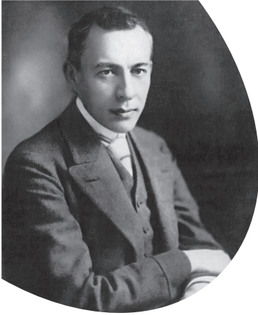
Sergej Rachmaninow (1901)

zur leicht alkoholisierten Mitternachtsparty und dem Morgen danach.