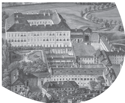
Schloss Mirabell. Ausschnitt aus einem Salzburg-Panorama von Johann Michael Sattler (1829)

Seiner eingangs gehörten Sinfonie Nr. 29 vergleichbar, schlug sich auch in der so genannten »Posthorn«-Serenade KV 320 nieder, was Wolfgang Amadeus Mozart auf Reisen beeindruckt hatte. Das Wort »Serenade« lässt sich ins Deutsche als »Abendständchen« übertragen. Im vorliegenden Fall ist es ein rein instrumentales Abendständchen. Die Komposition entsprang einer ortsgebundenen Tradition: Es war Brauch, dass sich Studenten in Salzburg beim Fürsterzbischof und bei ihren Professoren am Ende der ersten zwei Studienjahre mit derartigen »Final-