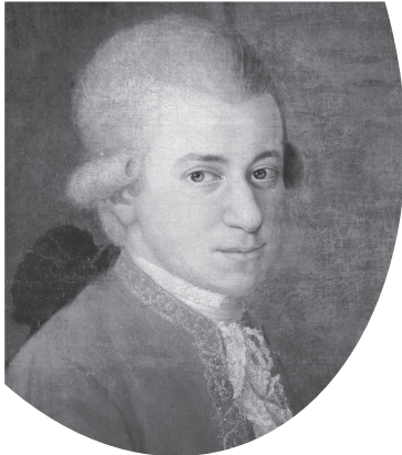
Wolfgang A. Mozart (um 1781). Porträt vermutlich von Johann Nepomuk della Croce

Reisen bildet. Wie bereits das erste Stück des heutigen Konzertprogramms beweist. Es verweist auf unterschiedliche europäische Vorbilder in der Gattung Sinfonie. Desse Komponist, Wolfgang Amadeus Mozart , hatte als Kind seine überdurchschnittlichen musikalischen Begabungen auch in London zum Besten gegeben. Dort lernte er Carl Friedrich Abel (1723-1787) und Johann Christian Bach (1735-1782) persönlich kennen. Beide machten seinerzeit auch mit ihrem jeweiligen sinfonischen Schaffen von sich reden. Ihre Orchesterwerke verbreiteten