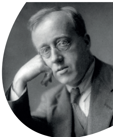
Gustav Holst (1921)

Der englische Komponist Gustav Holst (1874-1934) stammt aus einer künstlerischen Familie mit musikalischen Vorfahren in Riga und St. Petersburg. Noch während seiner Studien am Royal College of Music