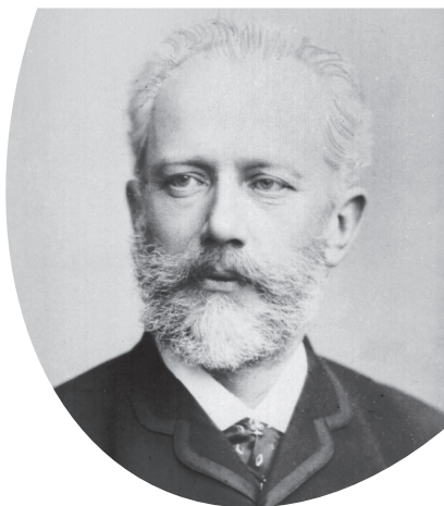
Peter Tschaikowsky (1888)

Wem fällt nicht, sobald er den Namen Tschaikowsky hört, der Beginn dieses Klavierkonzerts ein: vier kraftvolle absteigende Töne der Hörner – und dann die beiden ge-